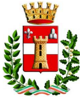
Sotto il Monte